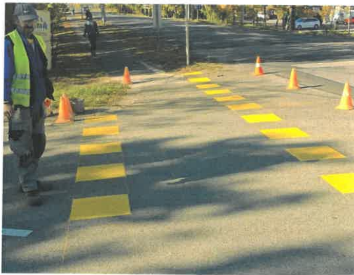
Útburkolati jel festése

A programba betervezett útburkolati jel festékekkel (sárga, fehér) a város belterületén lévő önkormányzati utak, gyalogátkelők (220 m 2 ), kerékpárutak útburkolati jelek (245 m 2 ), felezővonalak, parkolók (105,6 m 2 ) felfestését valósítottuk meg. Összesen 570,6 m 2 területet festenénk. 1 m 2 kb 3/4 kg festék kell. A feladat ellátásához úttesti bolyák vásárlását is terveztük, mivel az évek során az eddig rendelkezésre állók folyamatosan elhasználódtak, erre festék és bolya 526 872 Ft-ot támogatás lett igényelve.