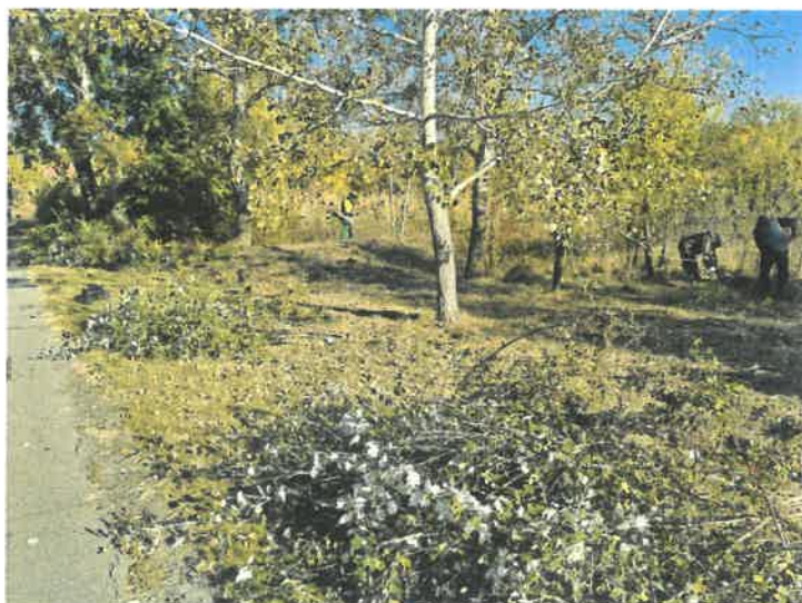
Cserjézés a város több utcájában, külterületen