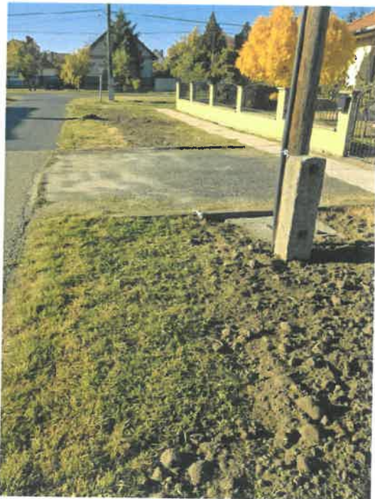
Megépített zárt csapadékvíz csatorna Arany J. utca és Hunyadi utca között

A csatornák feltöltéséhez továbbá szükséges a sóderágyra első réteggként a takaró föld, majd erre következik a jó minőségű termőföld, amely a zöld növényzet kialakításának fontos, amit az Önkormányzat biztosított.