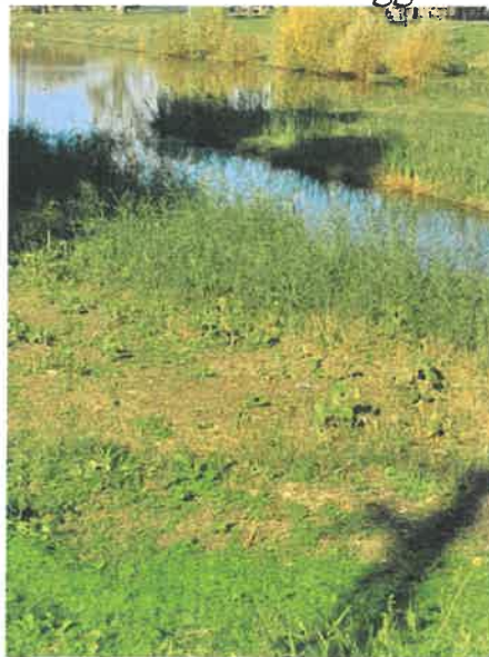
Hulladéktól megtisztított külterületi rész

A brigádok a városhoz közvetlenül kapcsolódó úthálózatok, kerékpárutak mellett, csapadékvíz csatornáknál, fasorok mellett, erdősávokban, fő csatornák melletti területeken, továbbá a belterületen illegálisan lerakott hulladékok begyűjtését végzik, hulladékgyűjtő zsákokba. 8000 db szemeteszsákot vettünk, amely 924 560 Ft-ba került. A beszákolt hulladék az e célra rendszeresített 1100 l konténerbe kerül, ahonnan általában heti sűrűséggel üríti a TAPPE Kft.