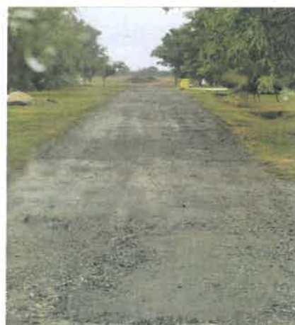
Meglévő útalapok kátyúzása