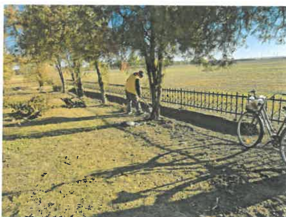
Orosz katonai temető új kerítésoszlop építés, kerítés elem festése