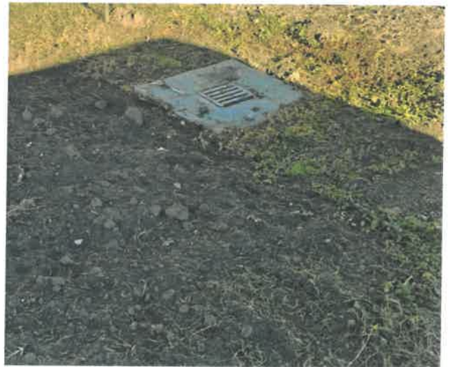
Víznyelő rácsok és hordalékfogók a város több pontján is megtalálhatóak