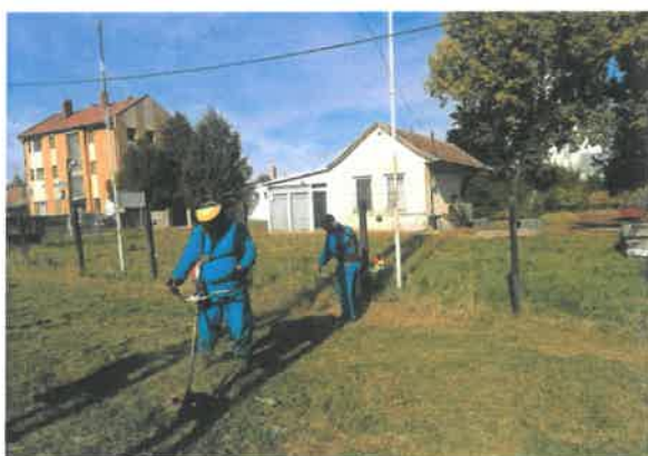
Fűkaszálás Kinizsi utcán

A közfoglalkoztatási program lehetővé teszi a város természeti és lakókörnyezet védelmét, rendbe tartását, a parkok, játszóterek, pihenőhelyek, kerékpárutak rendezettségét. Ezek közé számos tevékenység tartozik. Többek között a kaszálás, parlagfű irtás is. Tavasztól őszig 2 hetente rendszeresen kaszáljuk az önkormányzati utak és kerékpárutak egy részének padkáit. Végezzük a parlagfű irtást az utak melletti sávokba. Ezen feladat ellátásához gépalkatrészek lettek vásárolva, mind a fűkaszához, mind a fűnyíróhoz, illetve az üzemeltetéshez benzin, adalék-és kenőolaj valamint damil, ezek összes bekerülési költsége 3 466 881 Ft, egy évre vonatkozóan. Vásárolva lett további 3 db fűgyújtós fűnyíró is, ez 284 988 Ft értékben.