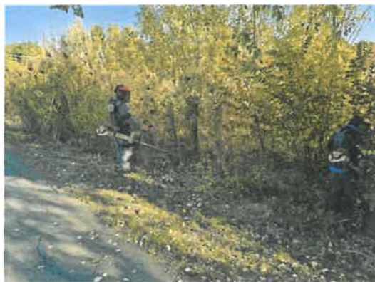
Fűkaszálás Kovács park