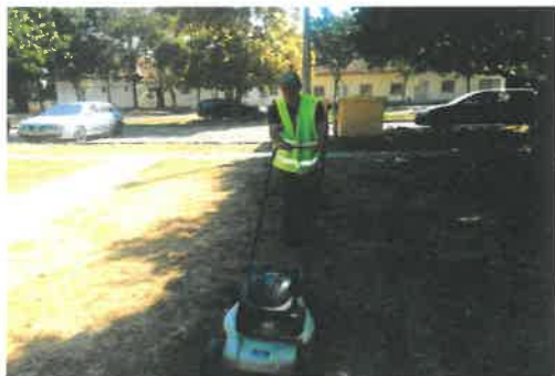
Fűnyírás Szabadság téren