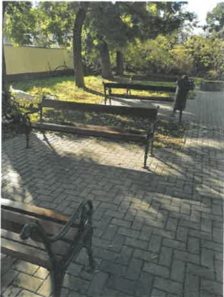
Közterületi padok karbantartása

Kiemelt feladatként kezeljük a játszóterek folyamatos takarítását és karbantartását is. Terveink között szerepelt, hogy a már közterületeken lévő 5 db homokozót(Dózsa utca, Bajcsy utca, Újtelep, Semmelweis utca, Szabadság tér) és 50 db padot felújítsuk. Ehhez homokra, gyalult deszkára és lazúr festékre volt szükség, amelyet szintén tartalmazott a költségvetés (1 175 184 Ft).