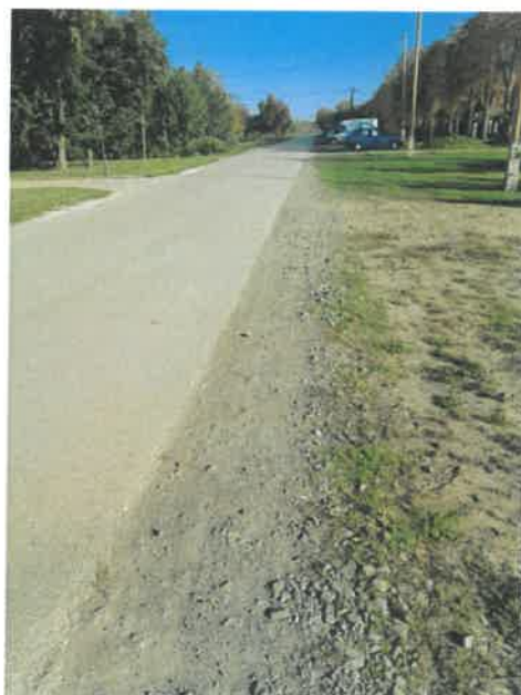
Nemesített padkák profilozása