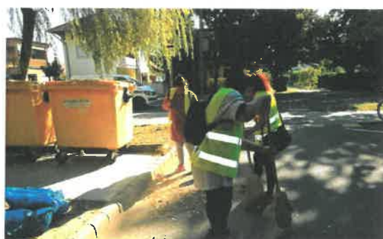
Kiemelt szegélyes utak takarítása