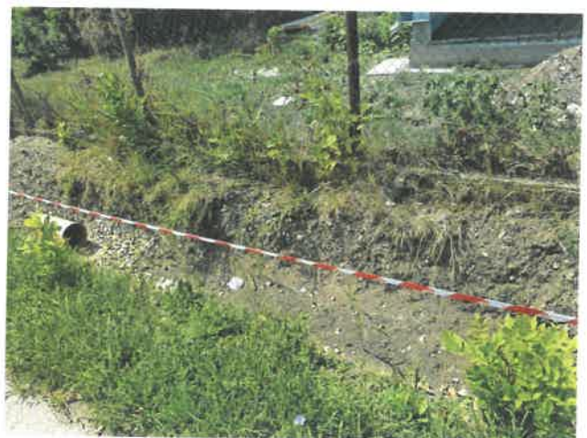
Billerbeck út mellett (904 hrsz)