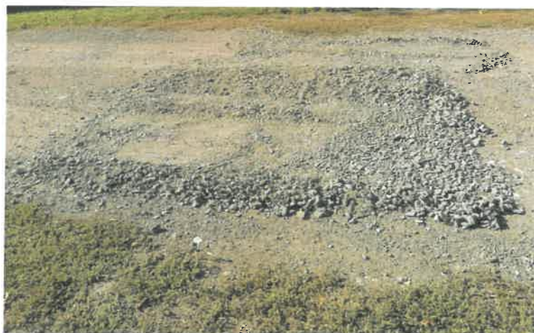
Kendereskert szórt útalap építése

A meglévő útalapok kátyúzásához, nemesített útpadka profilozásához valamint a Kendereskert útalap építéséhez 0/22 kőzúzalék (144 m 3 ) és 0/63 (90 m 3 ) kőzúzalék lett vásárolva, összesen 2 971 800 Ft értékben. Persze ezek a mennyiségek nem voltak elegendők a feladatok ellátásához, így a korábbi években töretett aszfalt illetve beton törmelékkel tudtak pótolni a még szükséges mennyiséget.