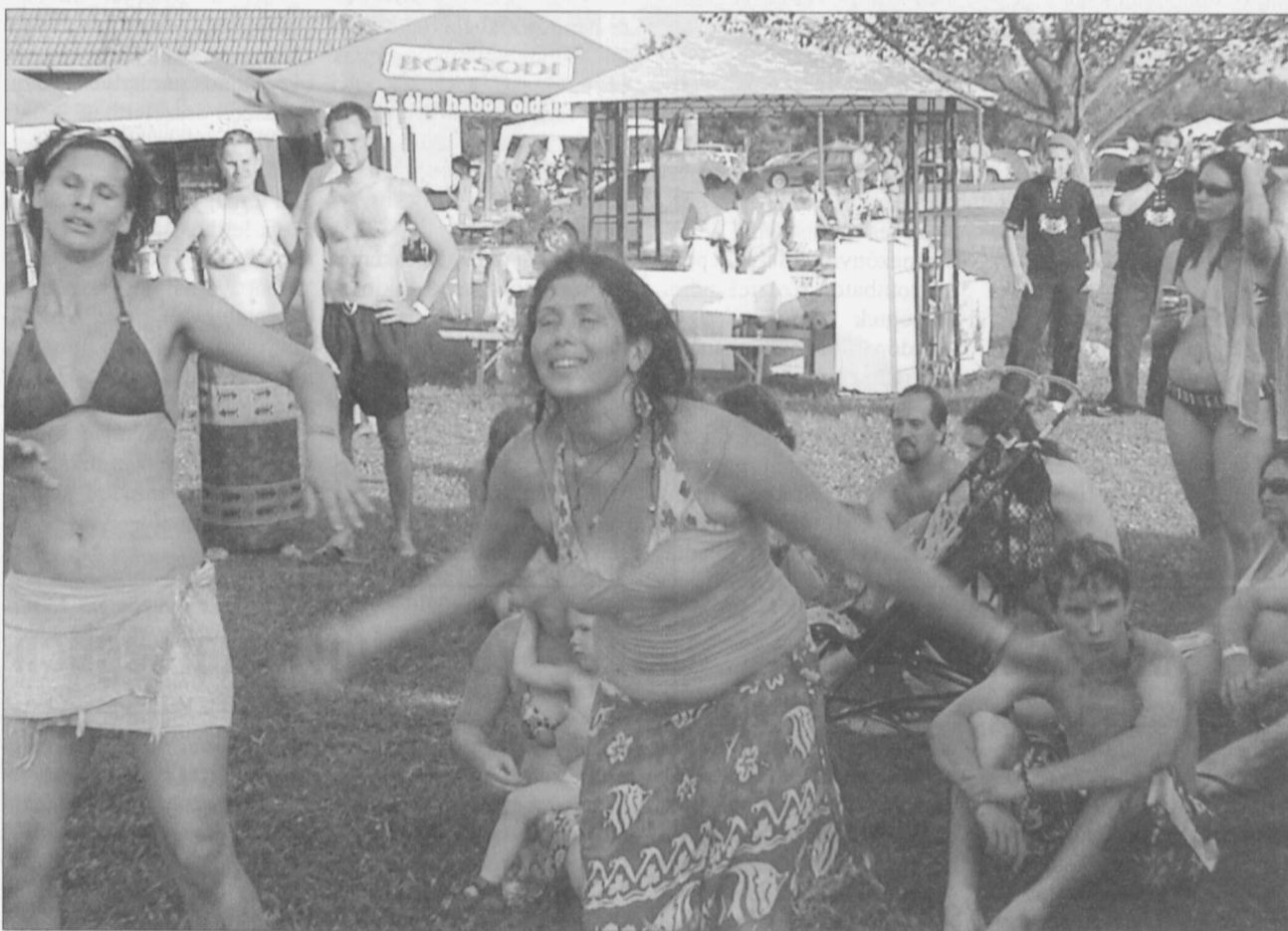
Körülbelül kétezer ember érezte jól magát augusztusban a Dobfesztiválon, és vitte a rendezvény és Dévaványa jó hírére a nagyvilágba