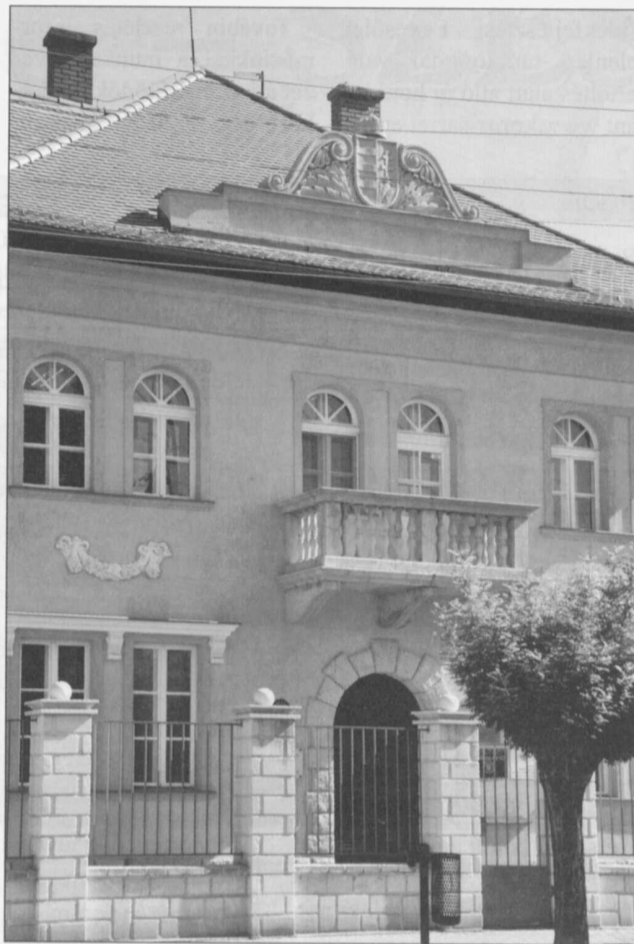
Nagy Miklós utcai Földhivatal a felújított címerrel

A program keretében a városközpontban kialakításra kerül a térfigyelő rendszer első üteme, valamint parlafű mentesítő akciókat szerveznek. Tájékoztató kisfilm készül a városi Rendőrkapitányság közreműködésével a biz-