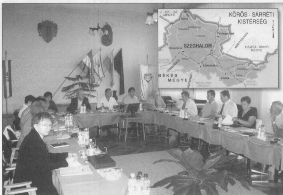
Vésztőn üléseztek a térség polgármesterei

A Körös-sárréti települések már 1993-ban rájöttek, hogy csak összefogással tudnak versenyképességgé válni. Mára a fejlesztési programokon közös pályázatokon, számos megvalósult projekten túl intézményeket is működtet a szervezet, mely a települési önkormányzatok többcélú kistérségi társulásáról szóló 2004. évi CVII. Tv. alapján az Észak-Békés Megyei Önkormányzati Térségfejlesztési Társulás jogutódjaként jött létre 2004-ben. A Szeghalom Kistérség Többcélú Társulás székhelye Szeghalmon található.