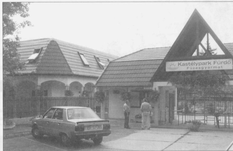
A fürdő bejárata a felújított motellel

tartalmaz eszközbeszerzést is (kézségfejlesztő játékok, bútorok). A TÁMOP „Kompetencia alapú oktatás Füzesgyarmaton” c. pályázaton 74 772 250 Ft-ot nyert a település. Az „Egészségügyi Központ felújítása és teljes körű akadálymentesítése” pályázat lebonyolítása is elindult. Várhatólag 2009 októberében itt is megkezdődhetnek az építési munkálatok. A „Személyszállító kisbusz vásárlása” és „a Macskási Ipartelep vezető külterületi út felújítása” elnevezésű pályázataik is kedvező elbírálásban részesültek.