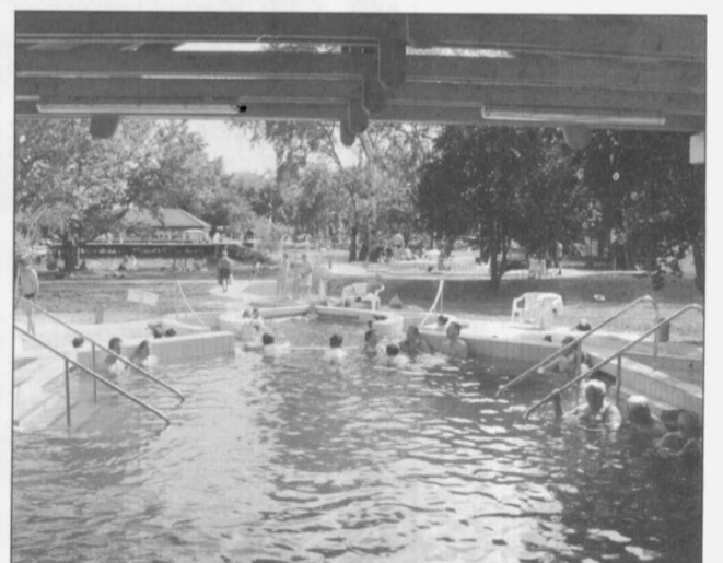
A Kastélypark Fürdő fejlesztésével a látogatók száma is növekedett

A településen tevékenykedő Polgármesteri Egyesület valamint a Gyöngyvirág Nyugdíjas Egyesület 2009-ben Dél - Alföldi Nemzeti Civil Alapprogramból 200 - 200 ezer Ft támogatásban részesült. Az elnyert összegből a 2009-es működési kiadásait fogják finanszírozni.