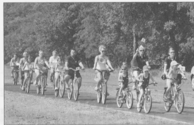
A Gyarmat-Szeghalom kerékpárút legszebb szakasza

Három hónap elteltével már elmondhatjuk, hogy reményeinkhez képest sokkal nagyobb a kihasználtsága a kerékpárútnak, a pozitív visszajelzések is azt bizonyítják, hogy érdemes volt megvalósítanunk ezt a projektet.