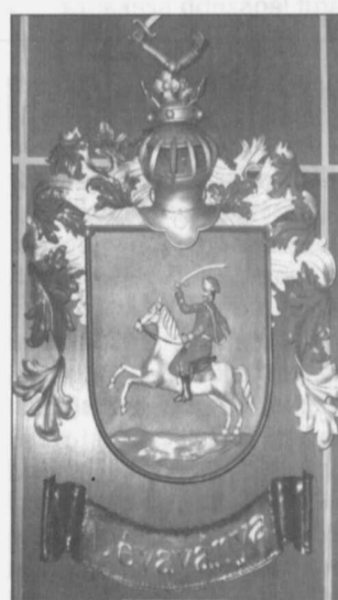
A Város történelmi címere

A projekt keretében a város főterén található zöldfelület rendezésre kerül. A tér sétálóútjai színes térközzel burkolattal lesznek ellátva. A kertépítészeti munkálatok legfontosabb célja a tér