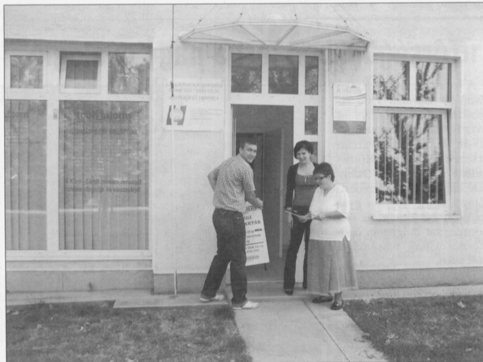
A kistérségi iroda

Előnyösebb-e, ha a pályázatok kistérségi szinten kerülnek beadásra? Egyes pályázatoknál a települések összefogása, a közös cél érdekében való tevékenység többletpontokat jelent. Léteznek kimondottan olyan pályázatok, melyekben a projektben résztvevők minimális száma fel van tüntetve. Konkrét példával élve, a Közmunka-programok szervezésére