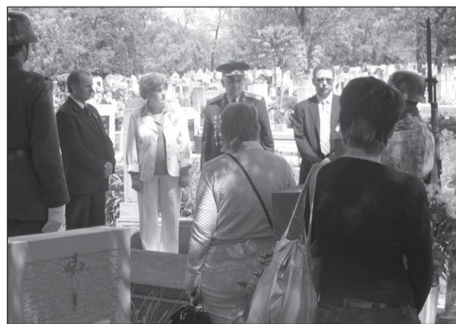
Szeghalmon méltóan ápolják a hősi halottak emlékét