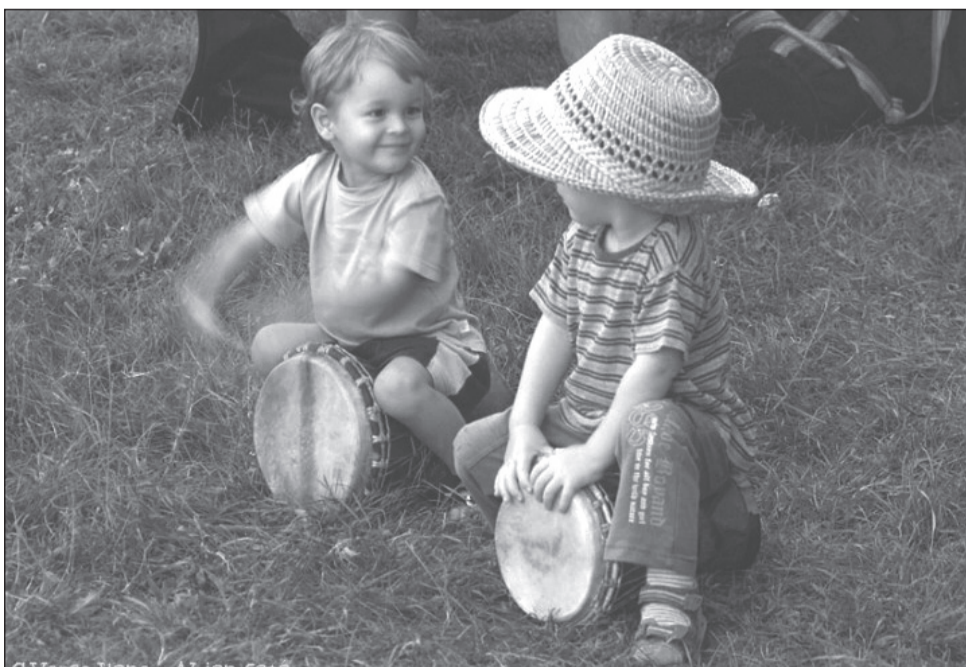
Idén is nagy sikert aratott Dévaványán a Dobfesztivál, mely által sok turista is ellátogatott a településre.

lió forint vissza nem térítendő támogatást nyertek az EU Önerő Alapból. Az új épület melegvíz- és fűtésellátásának biztosítására napkollektoros rendszer is rásegít. A beruházás keretében a Széchenyi utcai épületet újították fel, bővítették, s így a Mátyás és Kossuth utcai óvodaépületet sikerült kiváltani. A sárszegi óvodaépületben továbbra is működik a fejlesztőszeg. Kibővítették a játszódudart is, s ennek köszönhetően a mintegy 5 ezer négyzetméteres telken, 830 négyzetméter hasznos alapterületű, nyolc csoportszobás, 200 férőhelyes óvodaépület szülehetett Füzesgyarmaton. Az intézményben multifunkciós közösségi teret és a HACCP-előírásoknak megfelelő tállakonyhát is kialakítottak.