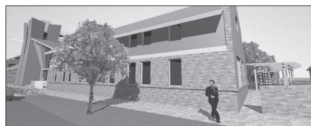
Az új intézmény látványterve