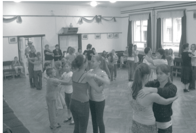
A tábor résztvevői esténként néptáncokat tanulhattak