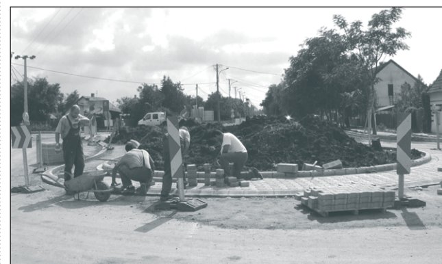
Ütemesen halad a körforgalom építése Vésztőn