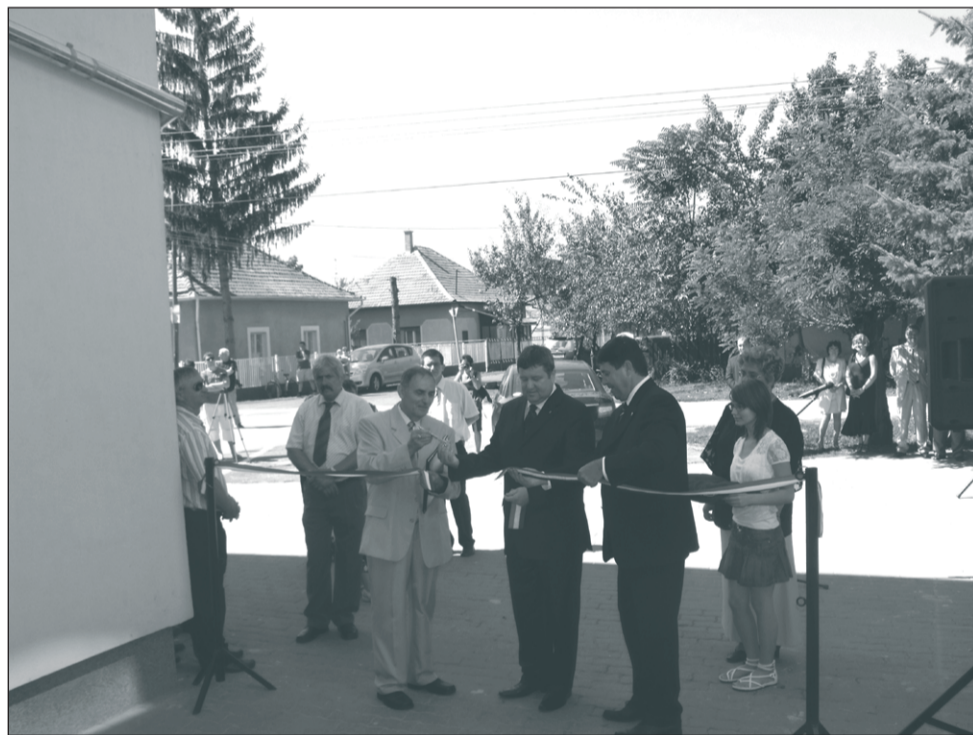
A felújított Ványai Ambrus Általános Iskola épületének átadása