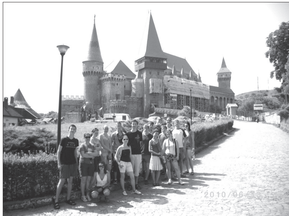
A csoport a vajdahunyadi várnál