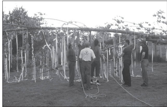
Májusfa állítás Körösújfaluban

Nagy hangsúlyt fektetünk a település tisztaságára, a fűnyírást, és szemétszedést folyamatosan végezzük a településen. A virágosítás, fásítás, parkosítás is fontos feladatunk. Kialakítottunk egy parkot is a községben. Adományokat szerezünk a lakosoknak, többször történt adományosztás egy adott évben. Pályázatot nyújtottunk be a ravatalozó épülete és a piacterem felújítására.