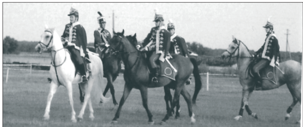
A program egyik látványossága a huszárok felvonulása volt

ugrató bemutató, fríz-fogat bemutató, fogat-lovas-torna bemutató) folytatták. Nagy sikere volt a „Guríts a sörért” versenynek, mely során 3 fős csapatoknak szalmabálát kellett gurítani időre. Az éjszakai gyertyafényes fogathajtás idén is nagy népszerűségnek örvendett!