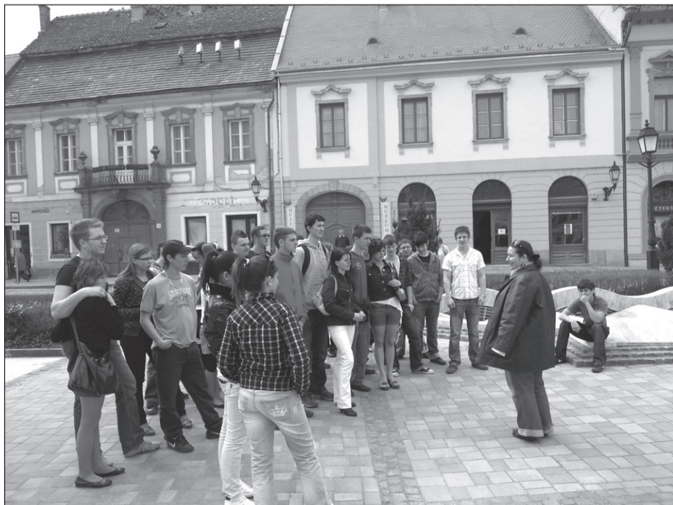
Diákjaink a foglalkozás első részében, történeti sétát tettek a belvárosban a helyi múzeum munkatársával.

ben, egy vasmű mellett, de így is gyönyörű látványt nyújtott, nem hiába nevezte Mikszáth Kálmán a „várak királyának”. Ezután feljutottunk a híres dévai várba is egy újépítésű sikkal. Itt a várból mecsodálhattuk a panorámát és a lábunk alatt elterülő 65 ezres várost. A hazafele úton áthaladtunk a festői Érc-hegységen és a Fehér-Körös völgyében haladva értük a határt Gyulánál és este fáradtan, de rengeteg újdonsággal és élménnyel gazdagodva megérkeztünk Szeghalomra.