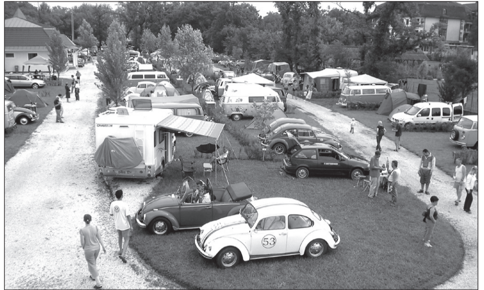
A Volkswagen bogarak benépesítették a kempinget

te a fürdőnek. A résztvevők a kempingben sátrakban és lakókocsikban táboroztak, ahol különböző csoportok főztek és szórakoztak a látványos, színes programokon. A legnépszerűbb esemény a gyorsulási verseny, illetve a Füzesgyarmaton és Szeghalmi áthaladó felvonulás volt, melyen 130 kocsi vett részt. Az esemény zenés programokkal és fürdőzéssel zárult.