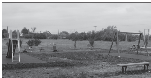
Egész napos ünnepséggel ünnepelve adták át Ecsefalván a játszóteret

dékozott a résztvevőknek. Délután a program báb előadással, tombolahúzással, táborúzzal és táncos műsorral folytatódott.