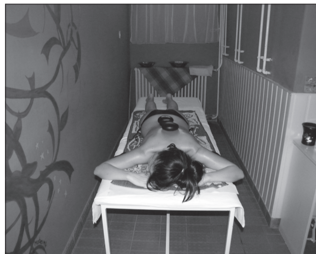
A legkedveltebb szolgáltatás a masszázs

A fürdő látogatóinak száma folyamatosan növekszik. 2009-ben csaknem 14 000 fő vette igénybe a szolgáltatásokat. A kezelések