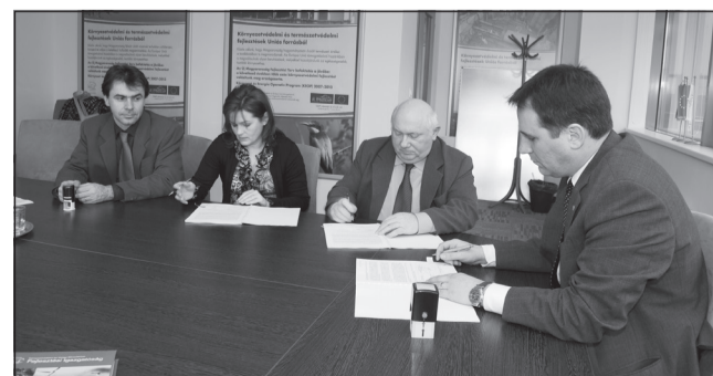
A támogatási szerződés aláírása

A tervezett beruházás bruttó értéke meghaladja a másfél milliárd forintot és előreláthatólag 2011-re be is fejeződik.