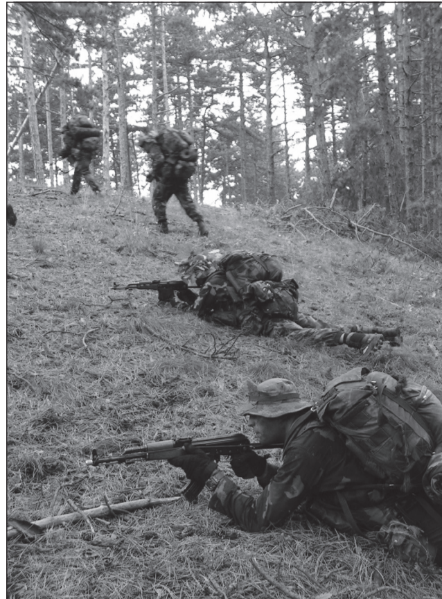
Terepgyakorlaton a jelöltek

A kiképzők a tanfolyam alatt a jelöltek által írt elméleti tesztek, a tereptan felmérés és a jelöltek egy-