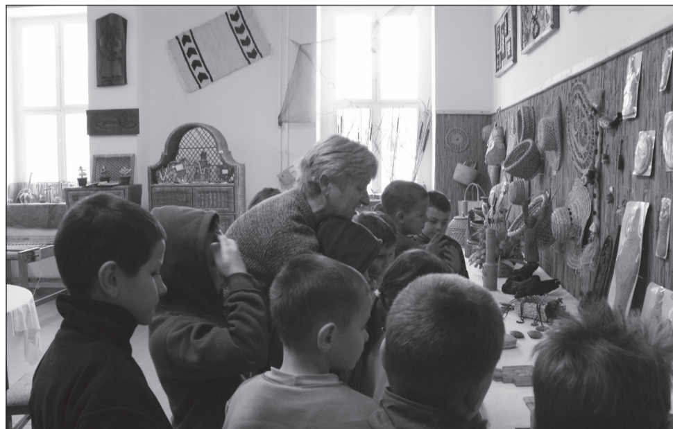
A kisiskolások érdeklődéssel tekintették meg a kiállítást

a látogatók, akik elismerő szavaikat folyamatosan jegyzik be a vendégkönyvbe, biztosítva arról az egyesületet, hogy munkájuk szép és hasznos. A kiállítás a mai napig látogatható, szeretettel várják az érdeklődőket.