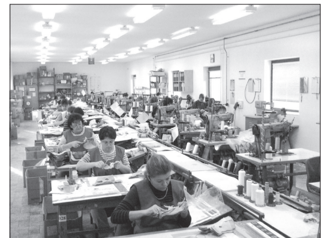
A cég sikerének fontos eleme a dolgozók magas színvonalú munkája