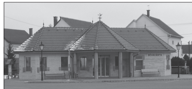
Az új buszváró